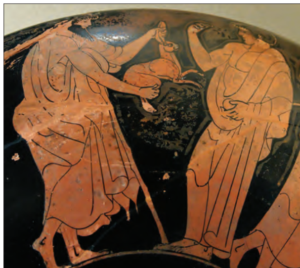
Ryc. 7. Erastes wręczający eromenosowi zającą w podarunku.