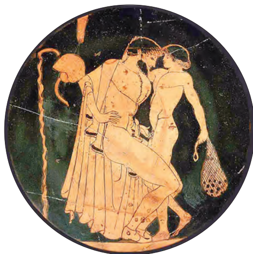
Ryc. 3. Pederastyczna scena zalotów – chłopiec trzyma w lewej dłoni prezent od erastes a – worek z astragalami. Kylik attycki, tzw. Malarz Brygosa, ok. 480–470 r. p.n.e. (Ashmolean Museum, Oxford)