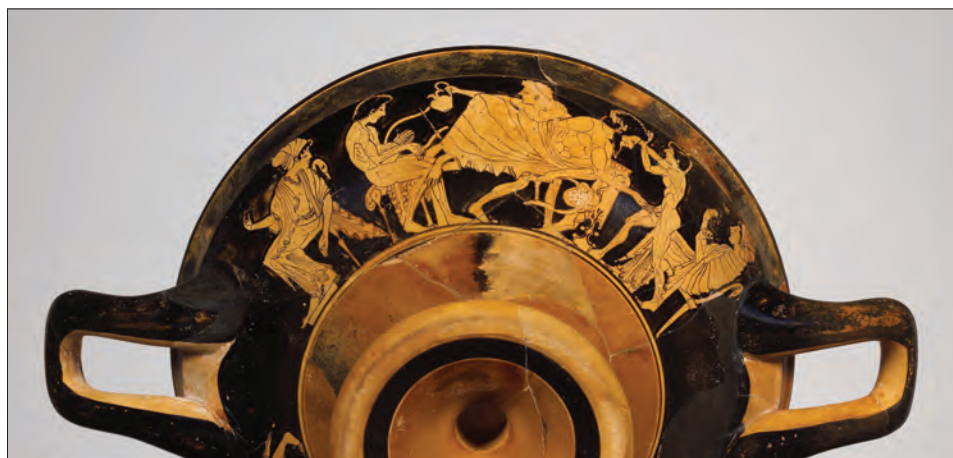
Ryc. 5. Scena sympozjonu, jeden z biesiadników chwyta chłopca za przyrodzenie. Kyliks attycki, ok. 500 r. p.n.e. (Metropolitan Museum of Art., Nowy York)