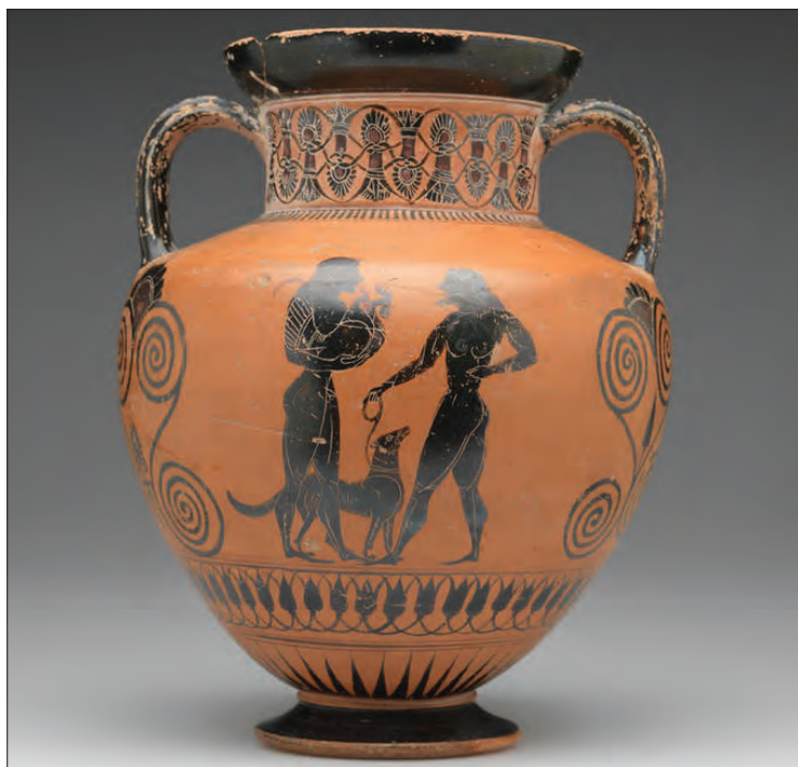
Ryc. 9. Erastes przekazujący w darze psa myśliwskiego i ptactwo. Amfora attycka, ok. 550–540 r. p.n.e. (Museum of Art, Rhode Island School of Design)