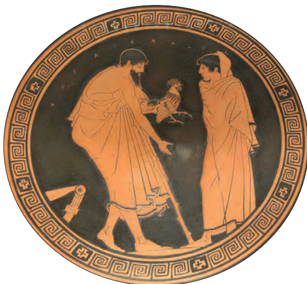
Ryc. 6. Erastes ofiarowujący eromenosowi koguta, inskrypcja: HO PAIS KALOS.

Kylik ateński, V w. p.n.e. (Ashmolean Museum, Oxford)