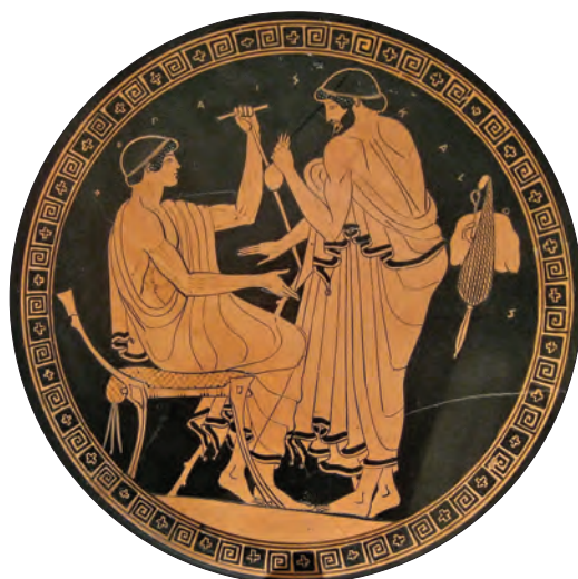
Ryc. 2. Erastes zabiegający o względy eromenosa w zamian za sakiewkę pieniędzy lub proponujący stosunek seksualny za pieniądze, inskrypcja: HO PAIS KALOS 51 .

Kylik ateniński, V w. p.n.e. (Metropolitan Museum of Art, Nowy York)