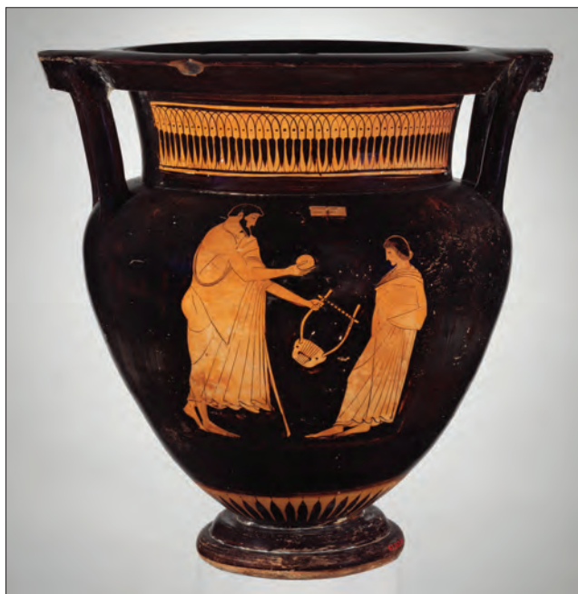
Ryc. 4. Chłopiec otrzymuje w prezencie piłkę oraz lirę. Krater attycki, ok. 475–465 r. p.n.e. (Metropolitan Museum of Art., Nowy York)