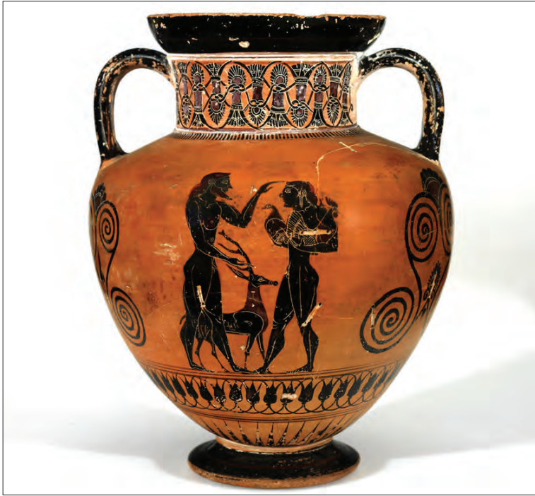
Ryc. 8. Erastes przekazujący w darze jelenia i ptactwo. Amfora attycka, ok. 550–540 r. p.n.e. (Museum of Art, Rhode Island School of Design)

Ponownie pojawia się tu metafora uwodzenia eromenosa do polowania, co widoczne jest również w literaturze, gdzie paidikia jest porównywany do jelonka 79 . Jednakże istotniejsze w przypadku jelenia jako podarku, jest jego pedagogiczne znaczenie dla rozwoju chłopca. Tak jak w przypadku zająca, zwierzę to mogło być użyte jako cel łowiecki, dzięki czemu έρωμενος mógł uczyć się zasad myślistwa. Dodatkowo w starożytności jelenia utożsamiano z pewnymi cechami, które mogły być wzorem do naśladowania dla chłopca. Według Eliana Klaudiusza jeleń jest zadowolony z tego co ma, raduje się ze swego losu: „Cervus, ut audio, ad vivendum praesentibus contentus est, nec plura desiderat, imo vero hominibus temperantius multo ventri moderatur” 80 , a według Arystotelesa zwierzę to jest inteligentne, ale nieśmiałe 81 .