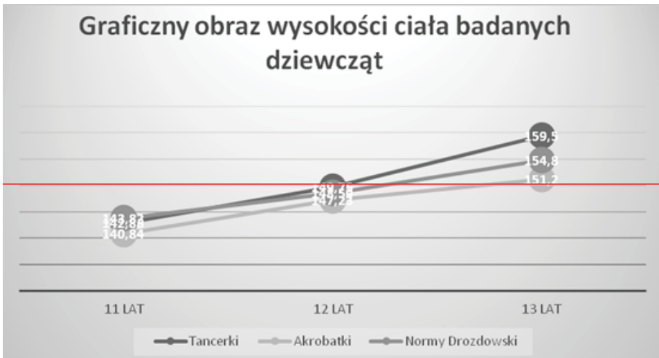
Rycina 1. Wyniki oraz porównanie średnich arytmetycznych pomiarów wysokości ciała

Poniższy obraz graficzny ilustruje wyniki pomiarów jednej z dwóch podstawowych cech somatycznych. Pierwszą poddaną analizie cechą była wysokość ciała. Badana grupa tancerek cechuje się większymi średnimi wartościami omawianego parametru we wszystkich porównywanych grupach. Jednakże różnice statystycznie istotne wystąpiły pomiędzy dziewczętami 13-letnimi i to w odniesieniu zarówno do akrobatek jak i do norm podanych przez Drozdowskiego.