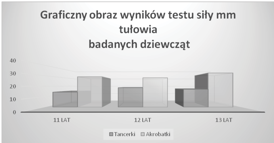
Rycina 4. Wyniki oraz porównanie średnich arytmetycznych pomiaru siły mięśni tułowia

Analiza danych porównawczych (tabela 11) oraz wyników przeprowadzonych badań w szkole baletowej wskazuje, że siła mięśni tułowia u dziewczynek trenujących akrobatykę sportową jest we wszystkich grupach wiekowych większa niż u uczennic baletu. Te wyniki pokazują po raz kolejny, że trening sportowy realizowany od 9 roku życia dał takie efekty. Interpretacja wyników osiągniętych przez uczennice szkoły baletowej wskazuje, że ćwiczenia związane z nauką tańca nie wymagają aż tak dużej siły mięśni tułowia, w przeciwieństwie do zajęć z akrobatyki sportowej.