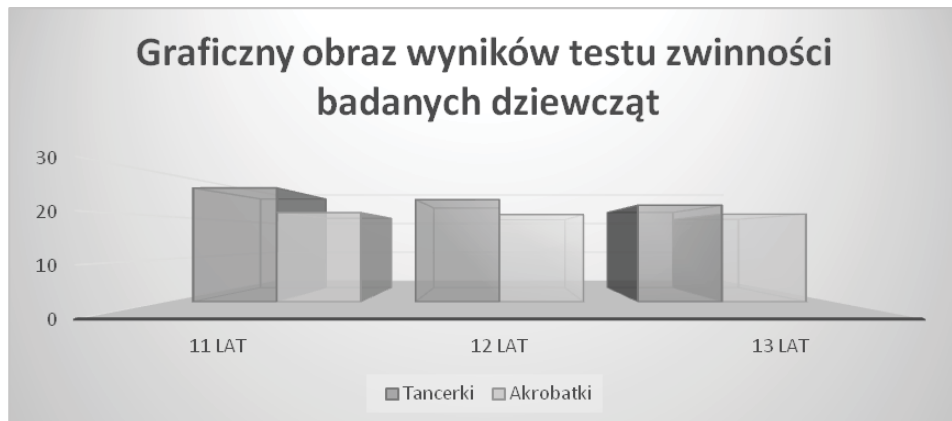
Rycina 6. Wyniki oraz porównanie średnich arytmetycznych pomiaru zwinności

wykonywania różnych czynności ruchowych (Barański, 1969), z całą pewnością należy do cech, które w znaczący sposób będą wpływały na poprawność i dokładność wykonywania technicznych elementów akrobatycznych, ale również i tanecznych.