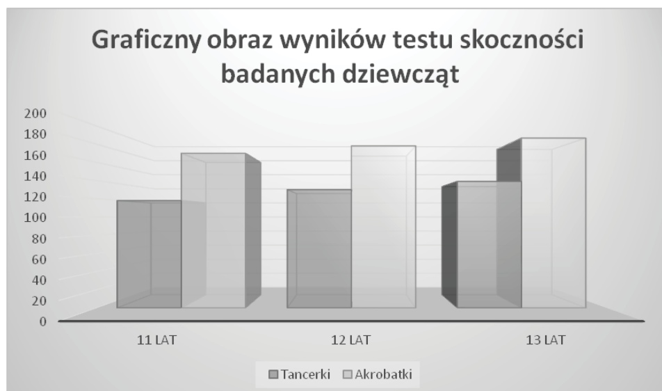
Rycina 5. Wyniki oraz porównanie średnich arytmetycznych pomiaru skoczności

Z punktu widzenia wykonywanych elementów choreograficznych zasadne wydawało się sprawdzenie poziomu skoczności obu grup. Choć struktura ruchu w akrobatyce skłania do wykonywania tzw. skoków tempowych, cechujących się dużą dynamiką, to jednak i w tańcu klasycznym występują elementy skoków czy piruetów.