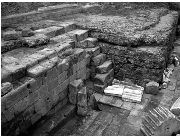
Il. 4. Pozostałości podium świątyni Augusta (Mateos, 2005: 381).

W centrum placu wznosiła się potężna, wzorowana na rzymskiej Aedes Concordiae świątynia (Mateos Cruz, 2005: 139–141) (il. 4).