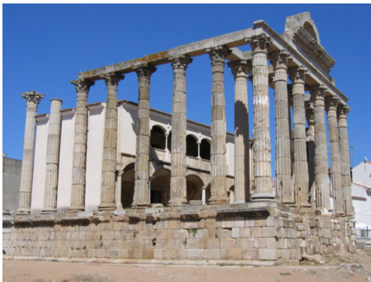
II. 3. Świątynia dedykowana Augustowi i Romie (tzw. świątynia Diany) wzniesiona na Forum Kolonii

znajdowało się po stronie południowo-wschodniej, gdzie budowla otwierała się na plac publiczny. Z placu można się było do niej dostać poprzez dwa ciągi schodów, zlokalizowane od wschodu i zachodu. Po stronie zachodniej i wschodniej świątyni znajdowały się pozostałości niewielkich basenów. Świątynię – peripteros i heksastylos – (około 32,80 x 22 metry; 43,80 x 22 metry – ze schodami) zdobiły kolumny korynckie. Do budowy obiektu wykorzystano granit z okolicznych kamieniołomów okładany stiukiem (Ayerbe Vélez et al., 2009: 20, 809).