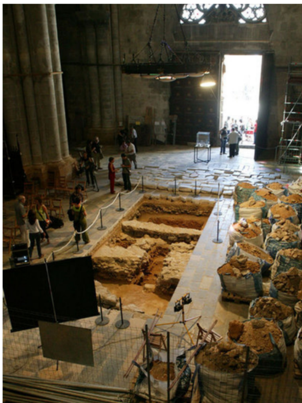
Il. 2. Pozostałości świątyni we wnętrzu katedry podczas prac archeologicznych