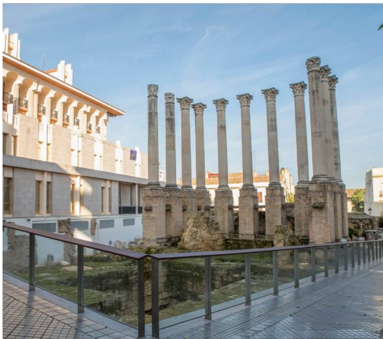
Il. 5. Świątynia przy ul. Claudio Marcelo

Marcelo wzniesiona między 50 a 55 rokiem (Santos Gener, 1955: 121) (il. 5).