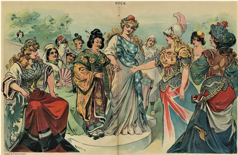
Іл. 8. Японія робить свій дебют під егідою Колумбії (Джерело: „Puck” 1899, August 16, https://www.loc.gov/item/2012647330/ )

до цієї сім'ї цивілізованих держав. На задньому плані можна помітити мало примітну жіночу фігуру, яка здивовано спостерігає за дійством, на яке її не запросили. Постать підписана як Китай. Стіну, з-за якої вона виглядає, можна розглядати в якості цивілізаційного бар'єру, що відмежовує „Піднебесну” від решти держав.