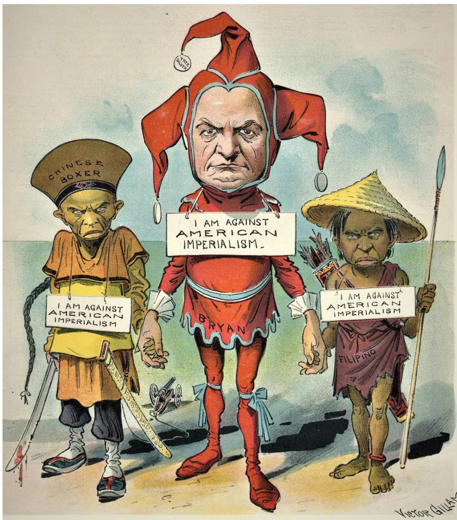
Іл. 20. „Переконливий демократичний аргумент проти імперіалізму” (Джерело: „Judge” 1900, August 11, https://elections.harpweek.com/1900/ cartoon-1900-large.asp?UniqueID=41&Year=1900 )

Проте, найбільш гострою у своїй критиці є карикатура авторства Віктора Гіллама, Переконливий демократичний аргумент проти імперіалізму (Іл. 20). На ній Браян зображений у вигляді дурника, що перебуває у компанії іхетуаня та філіппінського повстанця. Кожен із них тримає в руках таблички із надписом Я проти американського імперіалізму .