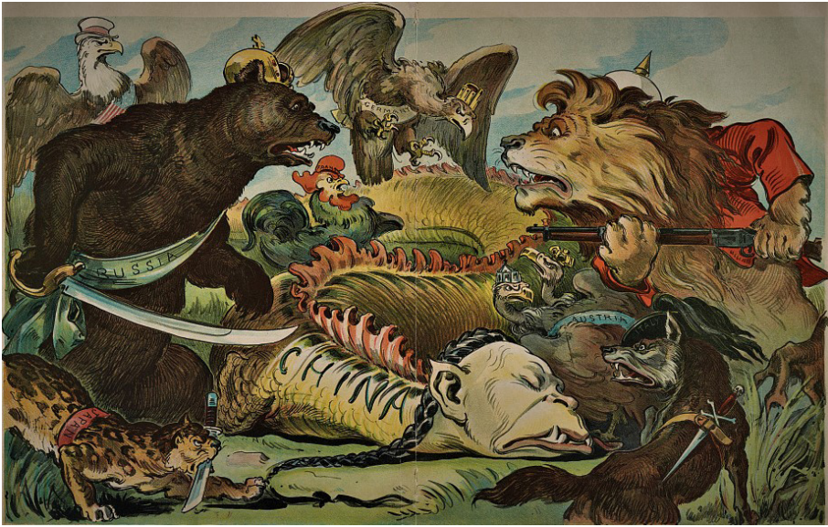
Іл. 16. „Справжня проблема виникне із пробудженням”

величезний меч, підписаний як Пробудження Китаю . В цілому, зображення має подібне із першою змістове наповнення: великі держави можуть проводити свою політику до того часу, поки Китай дрімає , однак загроза нового повстання, або ж якого-небудь антизахідного руху постійно присутня і може стати реальністю. Зрештою, застереження автора збулися 1911 р., коли розпочалася Сінхайська революція.