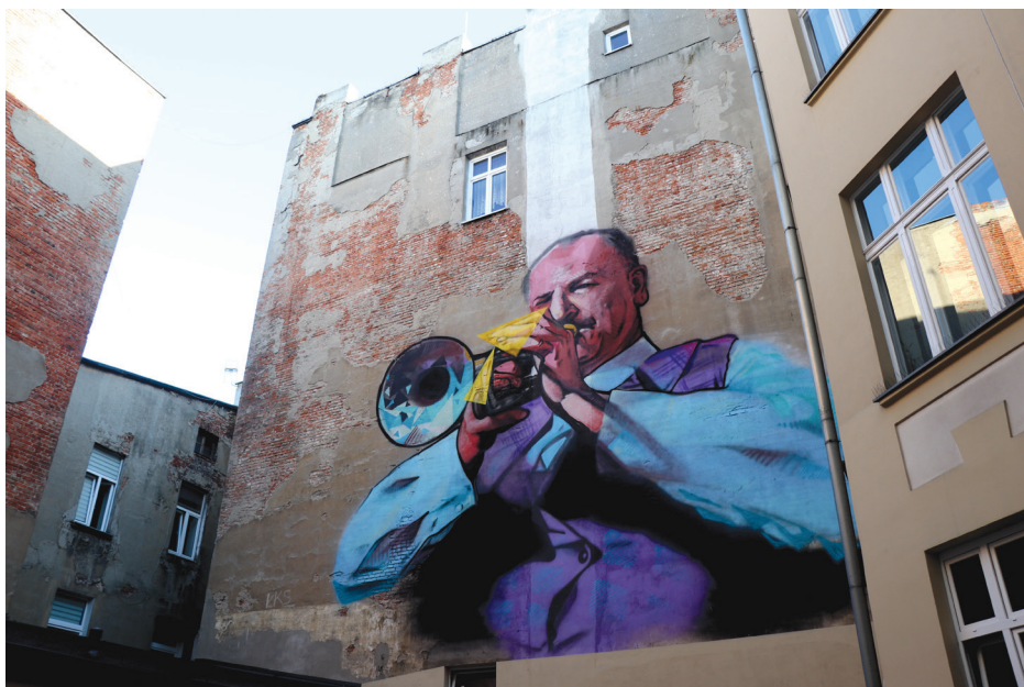
Fot. 1. Kamienica Vabank – Henryk Kwinto

Mural na ścianie kamienicy przy ulicy Piramowicza 6 (w podwórku) przedstawia głównego bohatera filmu Vabank Henryka Kwinto, granego przez Jana Machulskiego. Mural jest ciekawym przykładem nawiązania do historii miejsca oraz wykorzystaniem jej w czasach współczesnych – kamienica zagrała bowiem w kultowym filmie Juliusza Machulskiego. Obraz powstał dzięki obecnemu właścicielowi kamienicy, która nazywana jest Vabank .