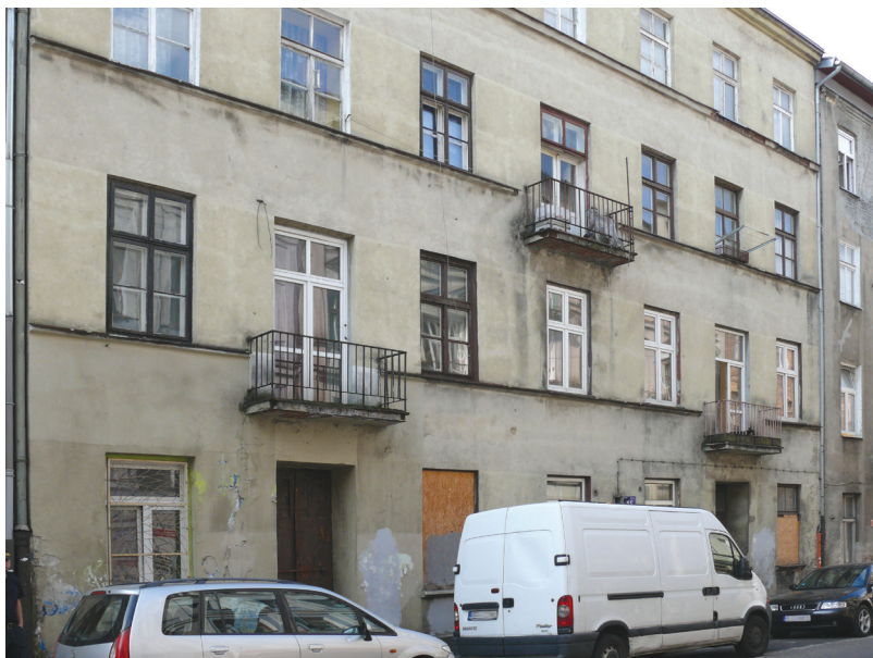
Fot. 6. Kamienica przy ul. Włókienniczej 15 w Łodzi, stan przed rewitalizacją