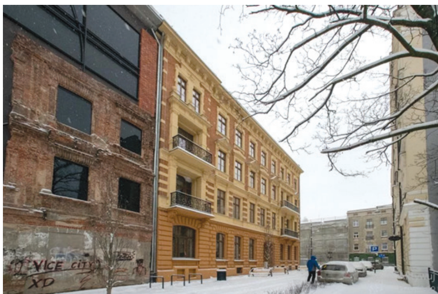
Fot. 8. Kamienica przy ul. Włókienniczej 22 w Łodzi, stan przed rewitalizacją i po niej